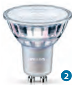
MASTER LEDspot Value 3,7 W/4,9 W