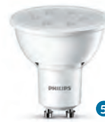
CorePro LEDspot 2 W