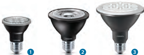
MASTER LEDspot PAR20 Dim MASTER LEDspot PAR30S Dim MASTER LEDspot PAR38 Dim