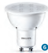
CorePro LEDspot 3,5 W/5 W