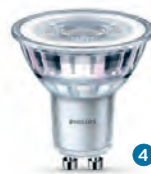
Classic LEDspot 3,1 W/3,5 W/4,6 W