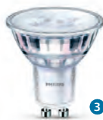
Classic LEDspot 4,4 W/5,5 W