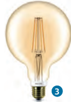
Classic LEDbulb gold Dim 7-50/55W ST64