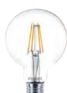
4 Classic LEDglobe klar 6-60W G93