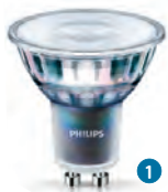
MASTER LEDspot ExpertColor 3,9 W/5,5 W